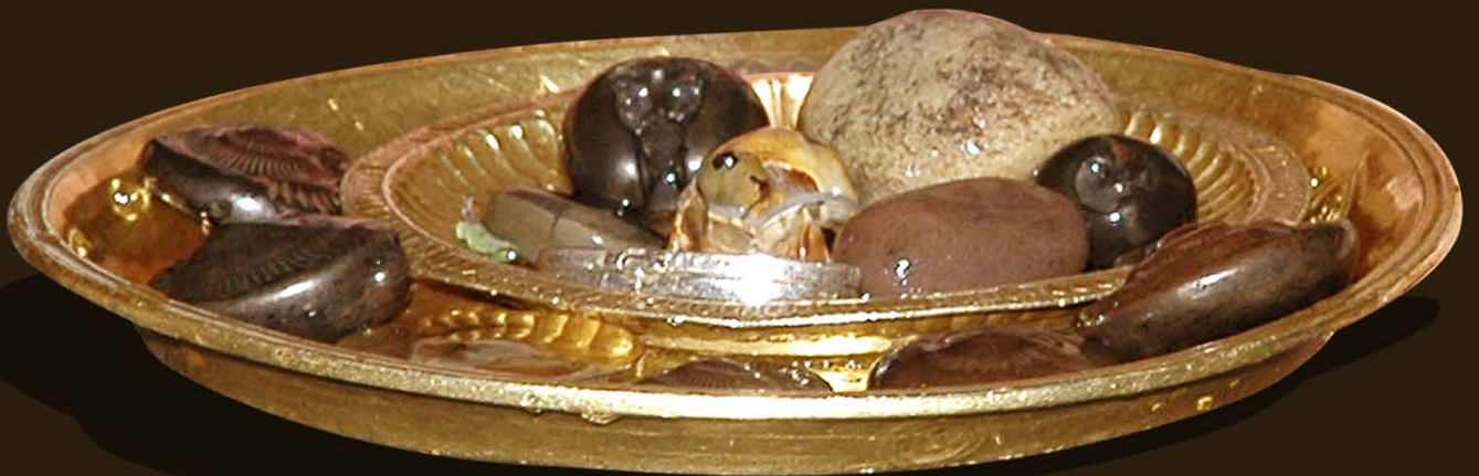
Shri Vyasa Mushti, Kurma Saligrama, Sudarshanas, Hayagreeva and other