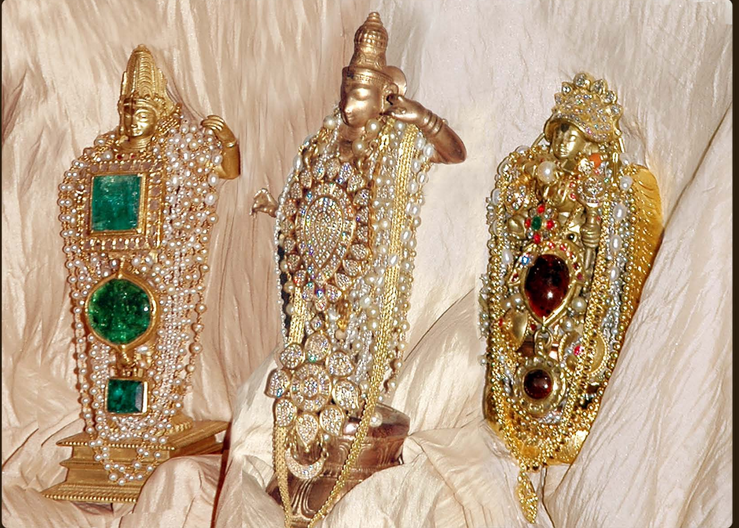
Shri Digvijaya Rama

Shri Chaturmukha Brahma Kararchita and Shriman Madhwacharya Kararchita Divya Pratimas containing Ananta Sannidhana of the Supreme Vishnu that are being worshipped daily in Shrimad Uttaradi Math