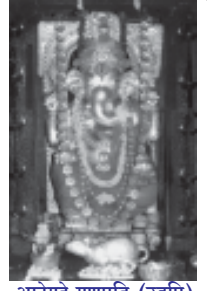
आनेगद्दे गणपति (उडुपि)